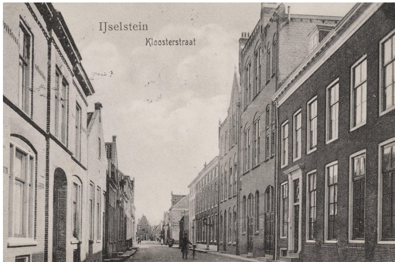
De Kloosterstraat met het tweede gebouw van rechts de rooms-katholieke meisjesschool, later de St.-Agnesschool genoemd.

In 1905 telde de school 144 leerlingen, waardoor het schoolgebouw te klein werd. Uitbreiden was niet mogelijk dus men besloot tot nieuwbouw op dezelfde locatie voor zowel de naai-, bewaar- en leerschool. Al snel was ook dit gebouw weer te klein en in 1919 vond een grote verbouwing plaats. Maar eind jaren twintig voldeed de bewaarschool niet meer aan de eisen van de tijd en werd een nieuw schoolgebouw aanbesteed die de Theresiaschool zou gaan heten. Ter gelegenheid van het