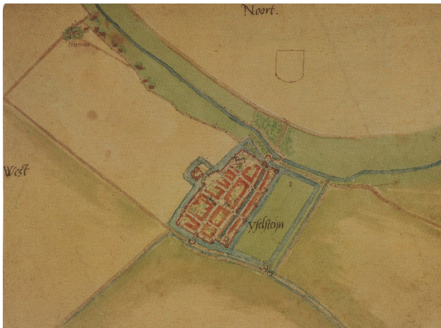
Plattegrond van IJsselstein, door Jacob van Deventer, ca. 1560. Linksboven, aan de IJssel, ligt Eiteren.

Vanaf de oprichting in 1855 werd de parochie bestuurd door een kerkbestuur. De pastoor was voorzitter en had een duidelijke stem in het bestuur. Het kerkbestuur behartigde voornamelijk de materiële zaken. Wat pastoraal beleid betreft, nam het een ondersteunende positie in.