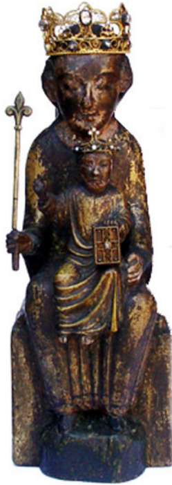
Het beeldje van Onze Lieve Vrouw van Eiteren na de restauratie. In 1986 werd het kind gekroond door de Aartsbisschop van Utrecht.

Eiteren was oorspronkelijk een dorp in het polderlandschap net ten noorden van de stad IJsselstein. Hier stond al sinds de tiende eeuw de parochiekerk of kapel van Maria ten Hemelopneming. In 1310 gingen de parochierechten over naar IJsselstein en werd de Eiterse kerk ondergeschikt aan de pastoor van de St.-Nicolaaskerk. Van het kerkje in Eiteren zijn tegenwoordig alleen nog wat fundamenten over. Het dorpje is verdwenen. In de negentiende eeuw werd daar de burgerlijke begraafplaats van IJsselstein aangelegd. 4