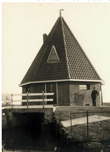
Het gemaal Breeveld na de verbouwing in 1931, met machinist C.J. Kooijman (W4763)

niet krachtig genoeg om de polder volledig droog te houden. In 1903 werd er daarom naast de molen een motorgemaal gebouwd om het overtollig water in de polder te helpen afvoeren. Het gemaal kreeg in de volksmond de bijnaam “De Bruine Beer”. Rond 1930 waren zowel de windmolen als De Bruine Beer in technisch zeer slechte staat. Het bestuur van de polder stond voor de keuze om ze te repareren en op te kalefateren of overgaan op volledige motorbemaling. Na enig rekenen en ondanks bezwaren van het provinciebestuur in Den Haag besloten de ingelanden of grondeigenaars in 1931 tot het laatste. De molen werd vervolgens omgebouwd tot gemaal: de bovenkant werd afgebroken en in de onderbouw werd de machinekamer met de motor ingericht. Op de onderbouw van de molen kwam een nieuw dak te staan. Ook werd De Bruine Beer afgebroken en werd er voor de machinist een nieuwe woning naast het gemaal gebouwd.