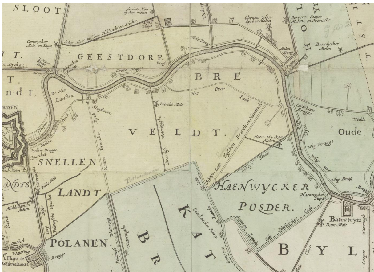
Fragment van de kaart van het Groot-Waterschap van Woerden van de gebroeders Vingboons, oorspronkelijk uit 1670, hier afgebeeld de versie van 1739, met daarop de polders Breeveld en Haanwijk (A1294).

De polder Breeveld was een onderdeel van het buitengebied, vroeger de poortertij, van de toentertijd Hollandse stad en gemeente Woerden en lag ten oosten van die stad. Ten noorden van de polder stroomde de Oude Rijn; langs de rivier liepen de Utrechtsestraatweg en de Breeveldseweg (in feite de Hoge Rijndijk). Aan de oostzijde vormde de Potterskade de grens met het Utrechtse waterschap Haanwijk, terwijl het vervolg van die kade met de Breeveldsekade de zuidelijke grens met het Utrechtse waterschap Cattenbroek markeerde. Ten westen werd de polder door de Cattenbroekerdijk gescheiden van de ook onder Woerden vallende polder Snel. De polder had een oppervlakte van ongeveer 315 hectare, waarbinnen onderscheid gemaakt werd tussen Hoog Breeveld (het zuidwestelijk deel, dat door afgraving voor kleiwinning een stuk lager was komen liggen) en Laag Breeveld (het noordoostelijk deel).