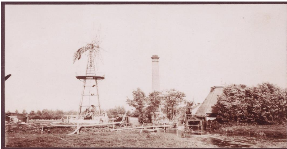
De Herculeswindmolen met rechts de restanten van de oude molen (W3716)

waterschap het risico dat de molen het weldra zou begeven of slechts ten koste van veel geld zou kunnen blijven draaien. Bestuur en ingelanden voelden daarom wel voor het voorstel van de twee naburige waterschappen Rapijnen & IJsselveld en Cattenbroek om gezamenlijk een stoomgemaal op te richten. Speciaal voor de bemaling van de drie waterschappen en het beheer van het gemaal met bijbehorende werken en personeel werd er een nieuw waterschap opgericht: de Gemeene Boezem van Rapijnen & IJsselveld, Cattenbroek en Haanwijk. Het gemaal kwam in 1874 gereed en werkte goed; desondanks hield Haanwijk zijn oude molen nog ruim tien jaar in stand voor hulpbemaling of gewoon voor de zekerheid. In 1885 werd besloten de molen buiten werking te stellen, het bovenste deel af te breken en het onderste stuk als woning te verkopen. Helaas bleek dat wat voorbarig: de bemaling door het stoomgemaal in Linschoten pakte voor Haanwijk minder goed uit dan aanvankelijk