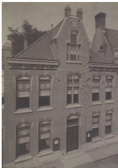
Het Gemeenlandshuis van het Groot-Waterschap aan de Havenstraat te Woerden, 1906 (SR0019).