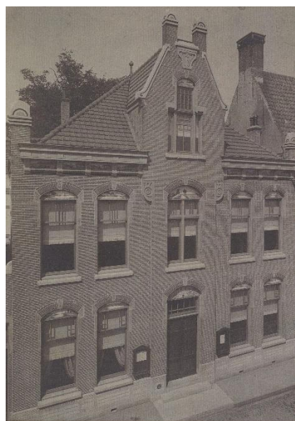
Het Gemeenlandshuis van het Groot-Waterschap aan de Havenstraat te Woerden, 1906 (SR0019).