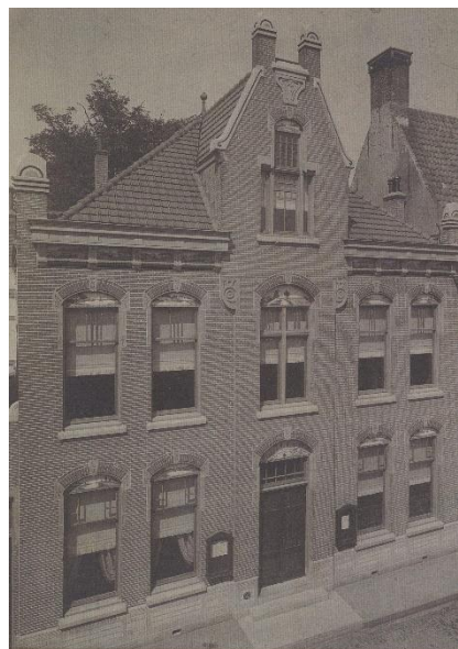
Het Gemeenlandshuis van het Groot-Waterschap aan de Havenstraat te Woerden, 1906 (SR0019).