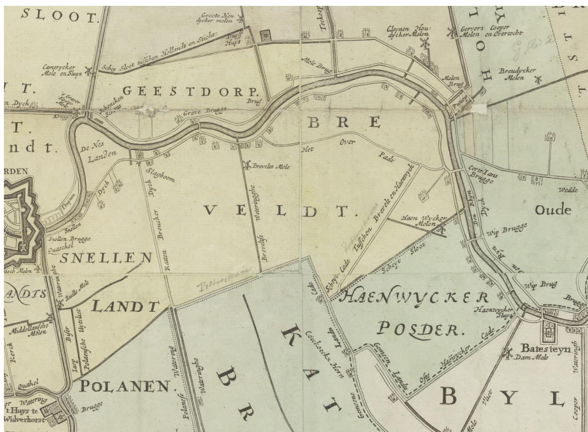
Fragment van de kaart van het Groot-Waterschap van Woerden van de gebroeders Vingboons, oorspronkelijk uit 1670, hier afgebeeld de versie van 1739, met daarop de polders Breeveld en Haanwijk (A1294).

De polder Breeveld was een onderdeel van het buitengebied, vroeger de poortertij, van de toentertijd Hollandse stad en gemeente Woerden en lag ten oosten van die stad. Ten noorden van de polder stroomde de Oude Rijn; langs de rivier liepen de Utrechtsestraatweg en de Breeveldseweg (in feite de Hoge Rijndijk). Aan de oostzijde vormde de Potterskade de grens met het Utrechtse waterschap Haanwijk, terwijl het vervolg van die kade met de Breeveldsekade de zuidelijke grens met het Utrechtse waterschap Cattenbroek markeerde. Ten westen werd de polder door de Cattenbroekerdijk gescheiden van de ook onder Woerden vallende polder Snel. De polder had een oppervlakte van ongeveer 315 hectare, waarbinnen onderscheid gemaakt werd tussen Hoog Breeveld (het zuidwestelijk deel, dat door afgraving voor kleiwinning een stuk lager was komen liggen) en Laag Breeveld (het noordoostelijk deel).