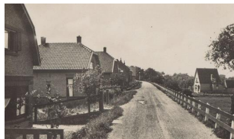
Hekendorpseweg, circa 1945.

De gezamenlijke grondeigenaars (de 'stemgerechtigde ingelanden') in de polder kwamen een paar keer per jaar met het bestuur bijeen om over de belangrijke zaken te beslissen, zoals de vaststelling van de begroting en de rekening, het benoemen van heemraden en personeel, de bouw of renovatie van de molen of het gemaal, het aangaan van geldleningen en het uitvoeren van grotere, dus duurdere werken aan de eigendommen van de polder. De ingelanden hadden meer of minder stemrecht op basis van hun grondbezit in de polder.